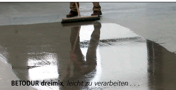
BETODUR dreimix , leicht zu verarbeiten...

Auf ungeschliffenen flügelgeglätteten Böden führt der Einsatz von MKS® BETODUR dreimix zu einer wesentlich einfacheren Reinigung, einer deutlichen Reduzierung des Abstaubens und zu einer starken Zunahme der Abriebs- und Chemikalienfestigkeit. Es entsteht kein Film, die einfache Anwendung reicht aus, eine Wiederholung der Applikation ist nicht notwendig. MKS® BETODUR dreimix wird auf neuen wie auf bereits genutzten Flächen eingesetzt. Kein negativer Einfluß auf evtl. Alkali-Silikat-Reaktionen.