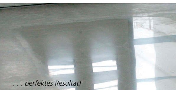
... perfektes Resultat!

Fragen zu MKS® BETODUR , sonstigen Betonvergütungen oder Wassergläsern? Einfach anrufen: +49 [0] 2871 / 24 75 24 wir beraten schnell und kompetent!